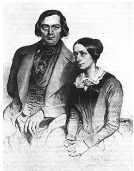
Robert und Clara Schumann

Die Kompositionen von Frauen, wie z.B. Fanny Mendelssohn-Bartholdy und Clara Schumann, wurden wenig veröffentlicht und diese Musikerinnen wurden entmutigt ( discouraged ), weitere Kompositionen zu schreiben. Sie haben aber viele Konzerte als Pianistinnen gegeben.