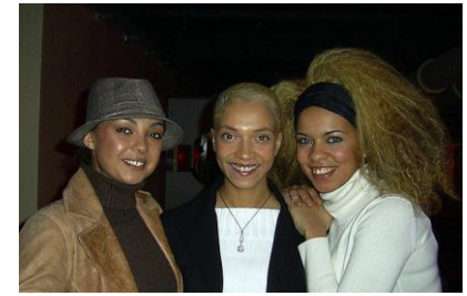
Tic Tac Toe

Seit Mitte der 1990er Jahre gibt es sehr viele verschiedene Musikstile in der deutschen Musik.