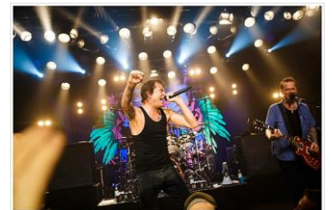
Die Toten Hosen